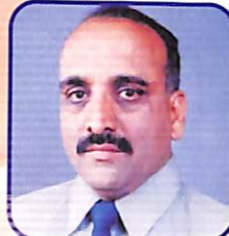
श्री. शरद पवार संचालक