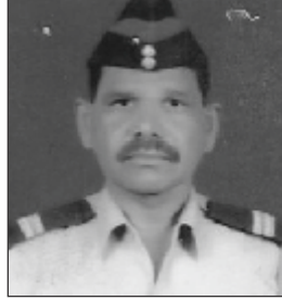
कै. महेंद्र दौलतराव भोसले