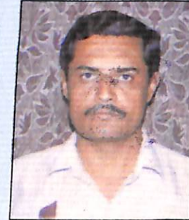
श्री. सं. ना. गट