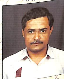
श्री. सं. ना. गट संचालक