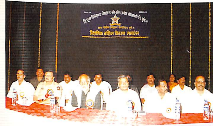
◀ मा. अध्यक्ष, चेअरमन, प्रमुख पाहुणे समवेत उपस्थित संचालक मंडळ

दि पूना डिस्ट्रिक्ट पोलिस को-ऑप. क्रेडिट सोसायटी लिमिटेड, पुणे. व सहाय्यक पोलिस आयुक्त (प्रशासन) पुणे - ४११ ००१.