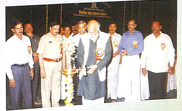
▶ मा. श्री. मंगेश तेंडुलकर प्रमुख पाहुणे दीपप्रज्वलन करताना