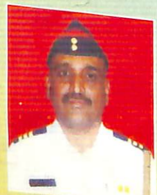
श्री. शरद पवार संचालक